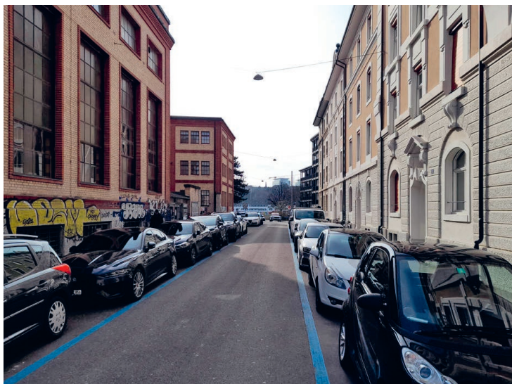
Basel – Burgweg: Eine städtische Strasse als Maschinenhalle ohne Dach?

Dass wir Autolärm im öffentlichen Raum für normal halten, hat auch sprachliche Gründe. Wir reden zum Beispiel von Lärmbelastung . Warum nicht häufiger von Lärmbelästigung ? Das Wort Belästigung erfasst den Lärm direkt von den betroffenen Menschen her. Es sind Menschen, die belästigt, behelligt und gestört werden. Und Menschen, die sie mit ihren Autos belästigen, behelligen und stören. Das Wort Lärmbelastung macht aus dieser Belästigung eine Last, die man vom Menschen wegrückt und beispielsweise wie ein Gewicht in Dezibel messen kann. Dies ist zweifellos wertvoll, weil man so Lärmgrenzwerte messen kann. Mit diesen schützt man heute vor allem Liegenschaften, weil dort Menschen schlecht schlafen und die Häuser so an Wert verlieren. Doch auch alle, die zu Fuss unterwegs sind, verdienen Schutz vor dem Dröhnen der Motoren. Der Wiener Verkehrsforscher Hermann Knoflacher hat treffend festgestellt, dass unsere städtischen Strassen wie Fabrikhallen ohne Dach wirken. Hier erzeugen Auto-Maschinen einen Lärm, vor dem man Fabrikarbeiter in ihren Hallen schützen würde. Dass wir diese Besitznahme der Siedlungsräume durch Lärm nicht als stärkere Zumutung empfinden, verdanken wir auch der Motonormalität, die uns vorgaukelt, Autolärm sei normal.